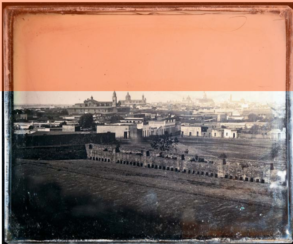
La zona de Retiro (1852)