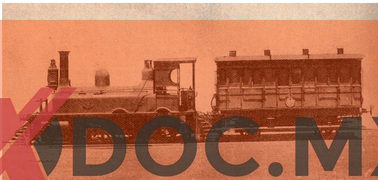
Tipo de Tren Rodante (1865)