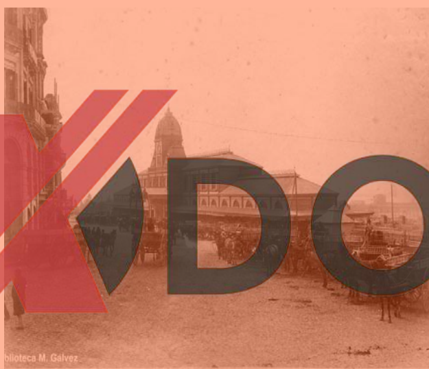
Estación Central de los Ferrocarriles Unidos del Norte. Capital Federal. Año 1876.

Fuente: Resultados Principales de la Explotación de los Ferrocarriles Argentinos, Boletín Nº 104, Congreso Sudamericano de Ferrocarriles, 1947.