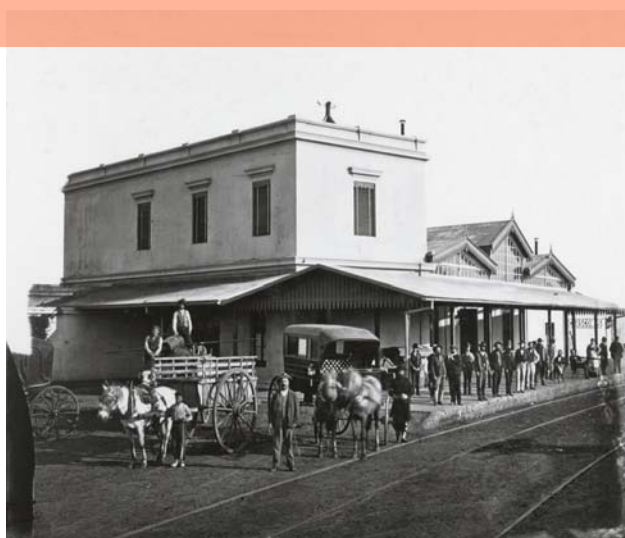
La Estación de Chascomús (hacia 1875) Fuente: Atribuida a Christiano Junior. Archivo General de la Nación. Gentileza Grupo Clarín.