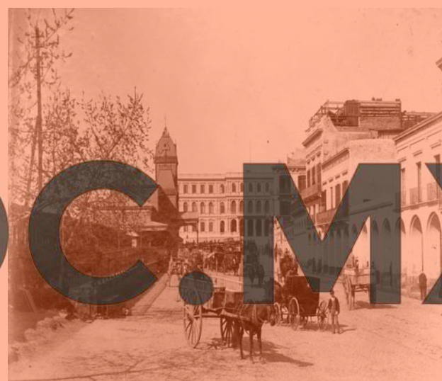
Estación Central de los Ferrocarriles Unidos del Norte. Capital Federal. Año 1876.