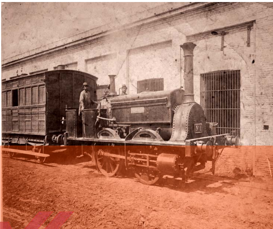
La Porteña (1857)