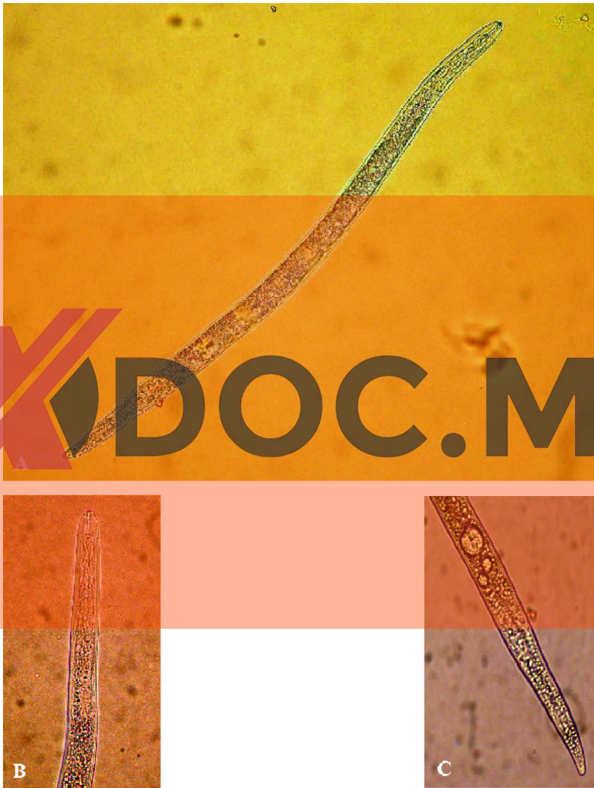
Figura 4. Nematodo lesionador ( Pratylenchus spp.). A. Hembra adulta completa. B y C. Región de la cabeza y cola de hembra, respectivamente.