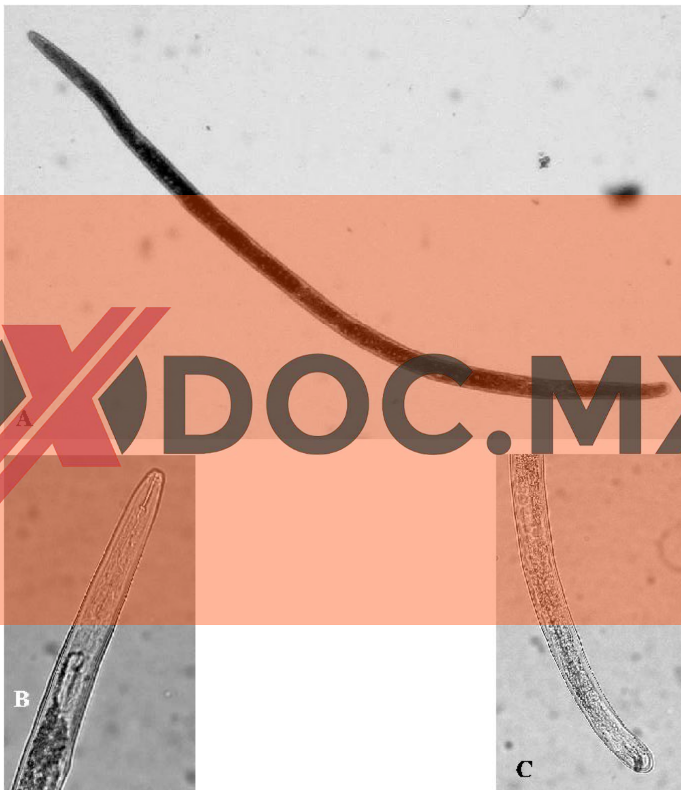
Figura 2. Nematodo nodulador de la raíz ( Meloidogyne spp.). A. Macho adulto completo. B y C. Región de la cabeza y cola de macho, respectivamente.