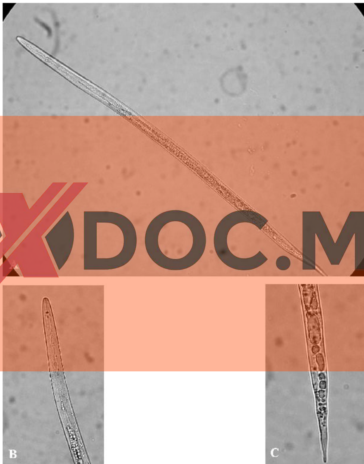
Figura 1. Nematodo nodulador de la raíz ( Meloidogyne spp.). A. Estado juvenil (J2) completo. B y C. Región de la cabeza y cola de J2, respectivamente.