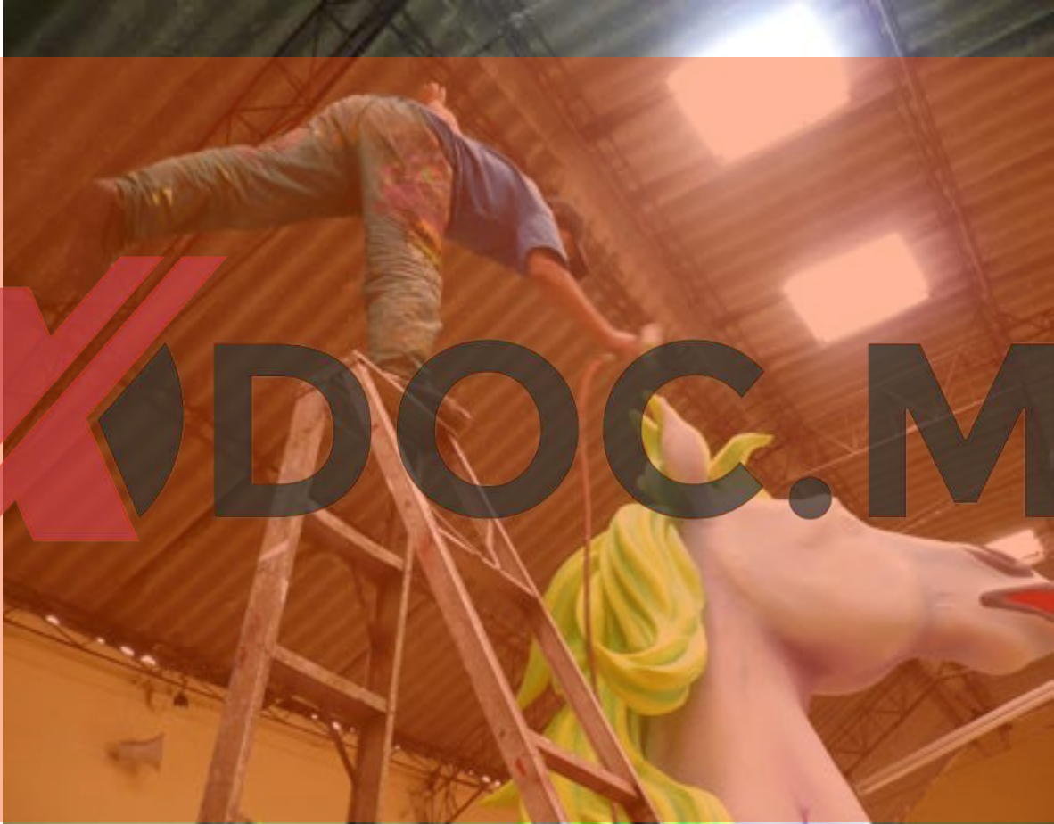
Taller del Artista Harold Otero - Carnaval de Negros y Blancos de Pasto 2011.